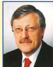
Heinz Paus Bürgermeister

Der Sommer 2003 hat es mit den Freilichtbühnen außergewöhnlich gut gemeint. Auch die Freilichtbühne Schloß Neuhaus konnte, begünstigt durch die vielen schönen Sonnentage, mit über 14.000 Zuschauerinnen und Zuschauern eine überaus erfolgreiche Saison für sich verbuchen.